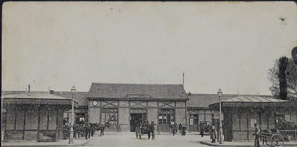
ROCHFORD-SUR-MER — La Gare de l'État