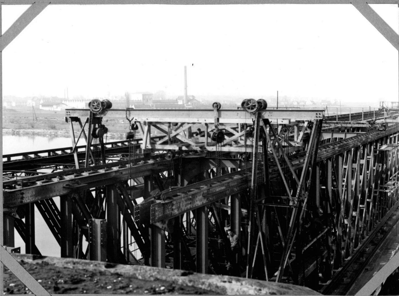
Dépose du tablier métallique 1 ère travée , rive allemande, en cour de démontage Vue d'ensemble 21 - 3 - 1938