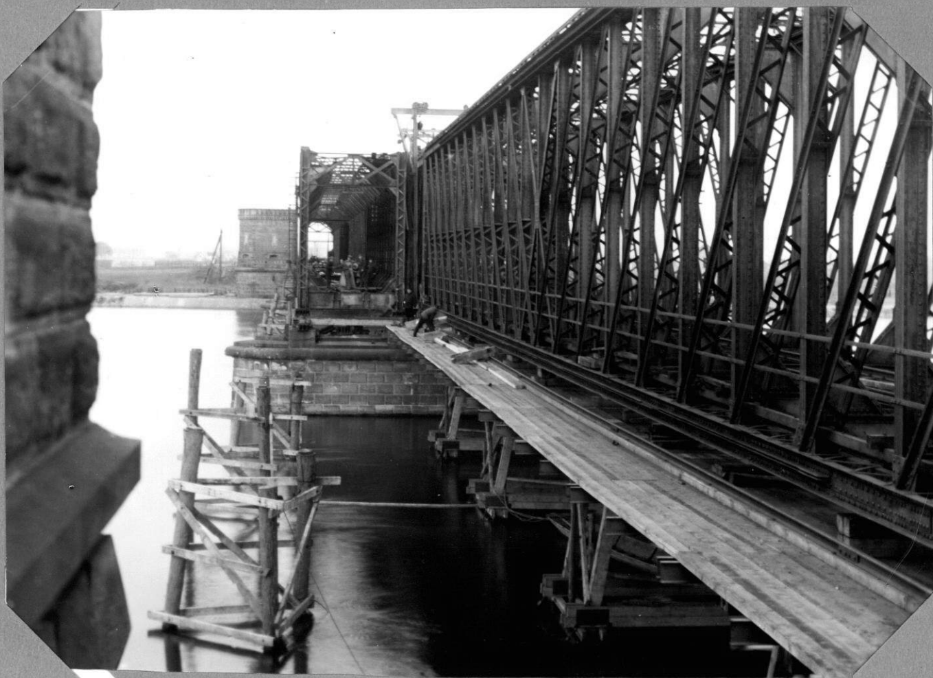
Dépose du tablier métallique Vue d'ensemble après ripage de 1 er travée en fer 21-4-1938