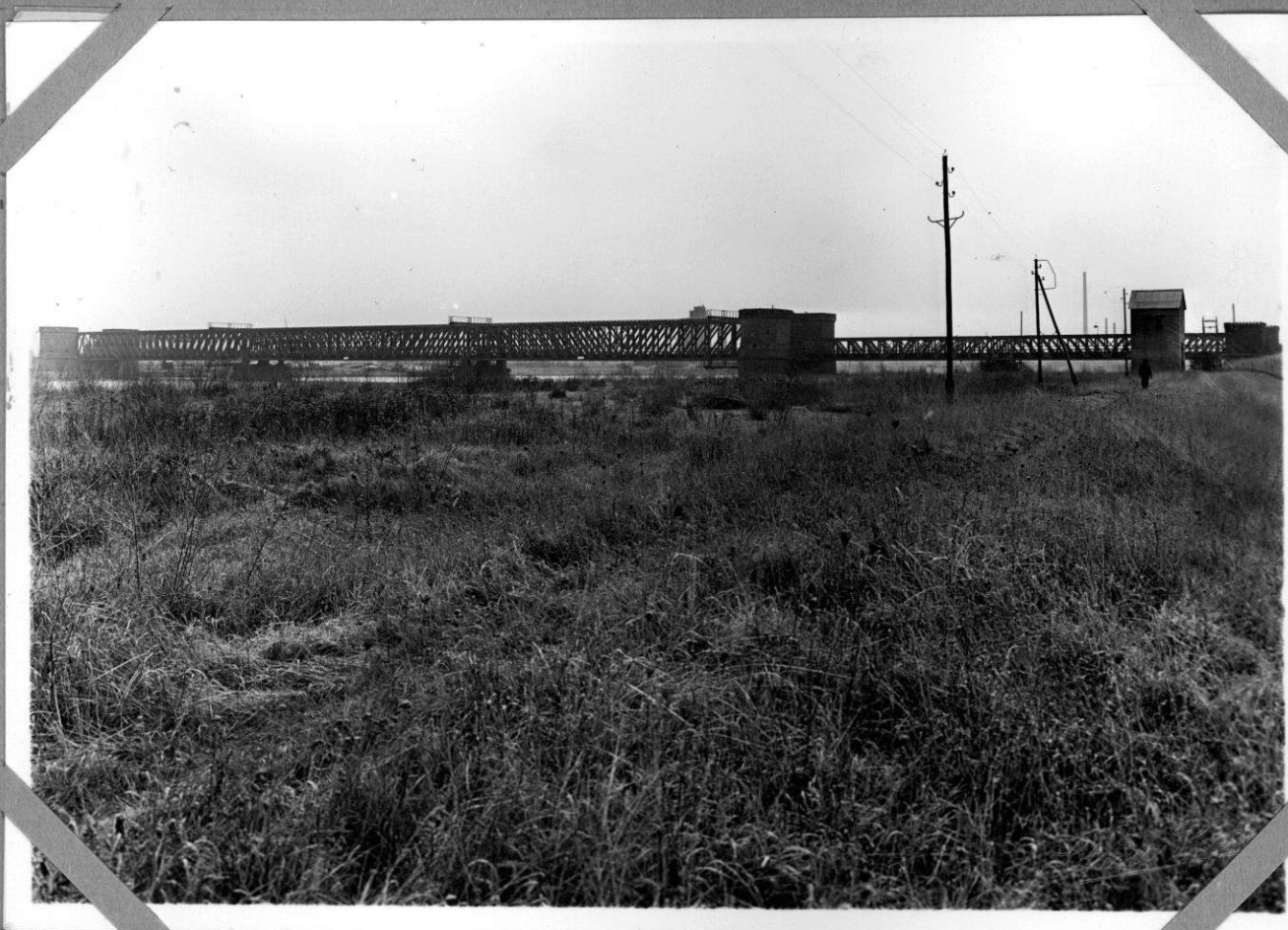
Dépose du tablier métallique Situation avant commencement des travaux Vue prise du côté Nord-Ouest (aval) 30.12.37