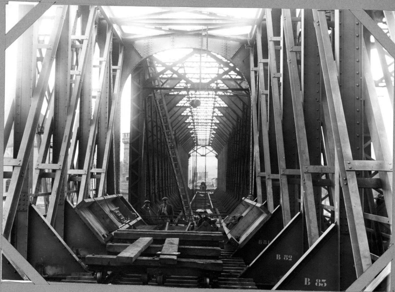
Dépose du tablier métallique fin du ripage du tablier en fer de 1ère travée 21-4-1938