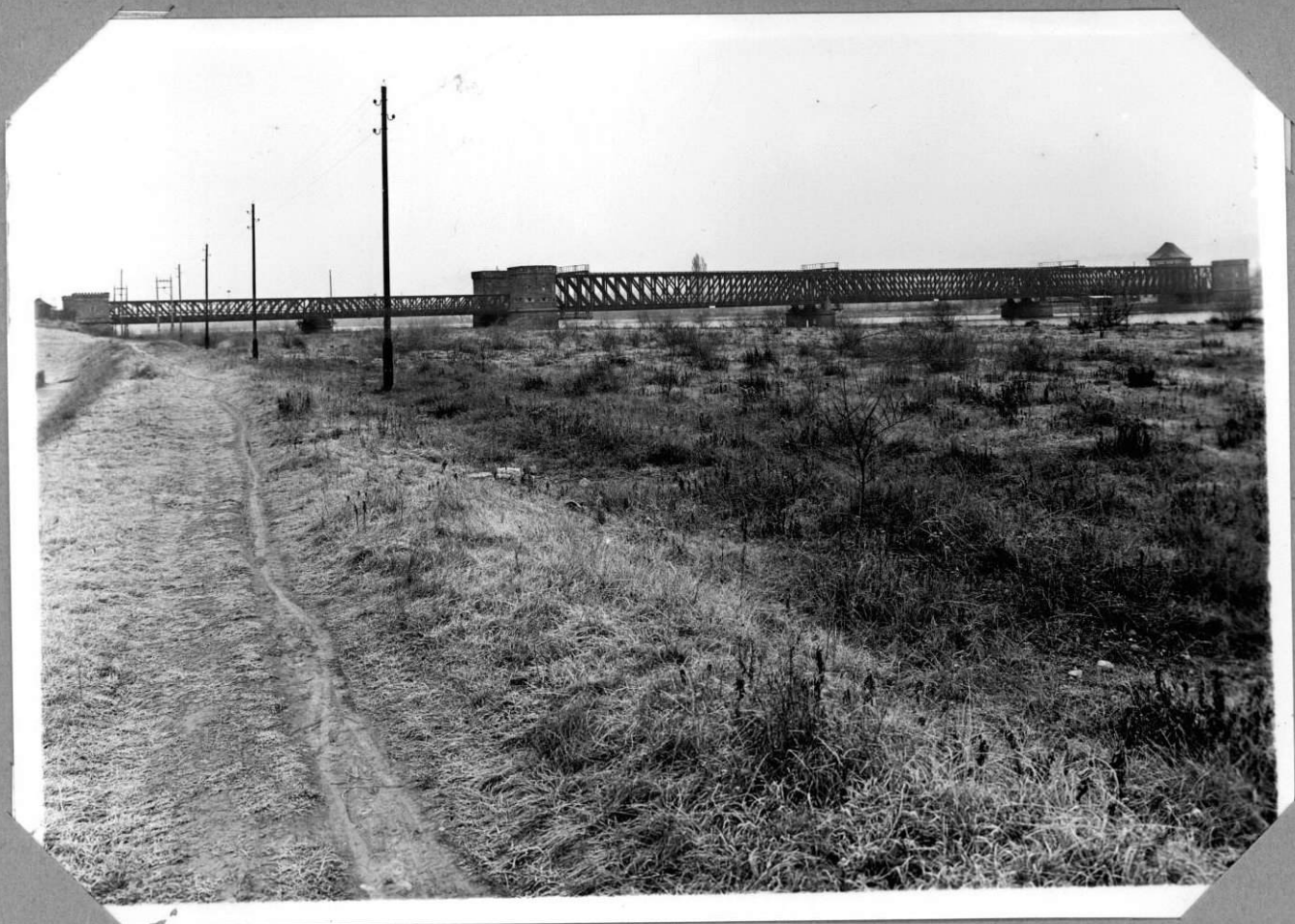
Dépose du tablier métallique Situation avant commencement des travaux vue prise du côté Sud-Ouest(amont) 30.12.37