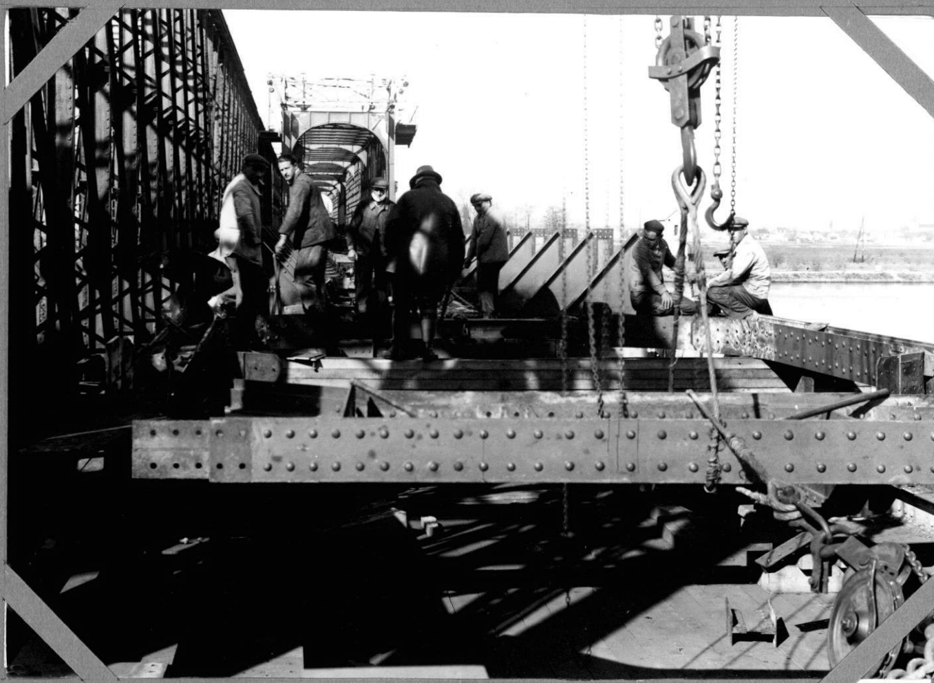
Dépose du tablier métallique Démontage du portique sur la culée rive droite 8-4-1938