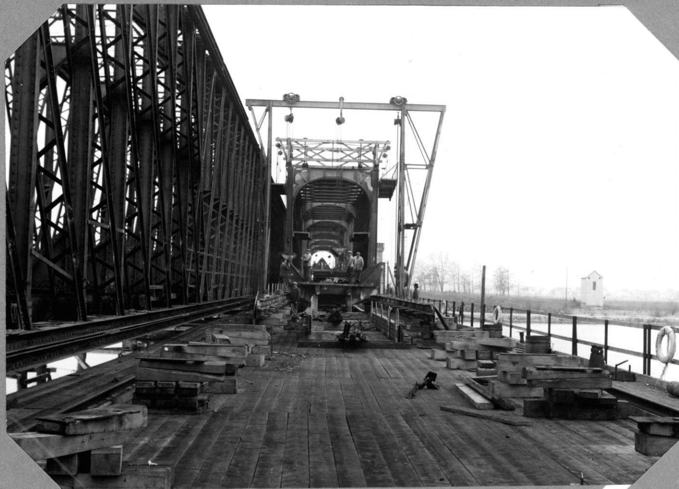
Dépose du tablier métallique Démontage de la travée "A" en acier 14-4-1938