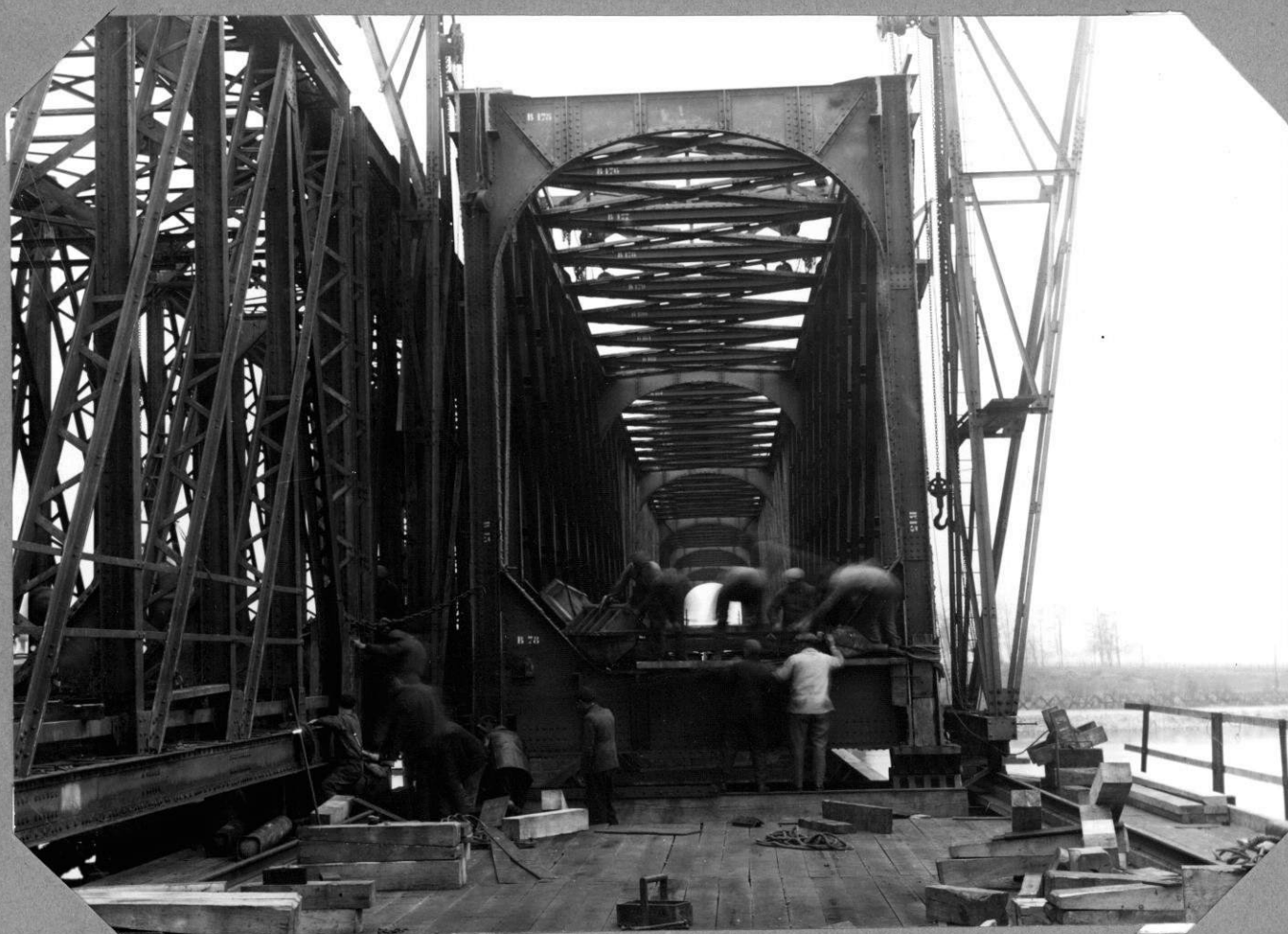
Dépose du tablier métallique Mise en place du dispositif de rîpage du vieux tablier 21-4-1938