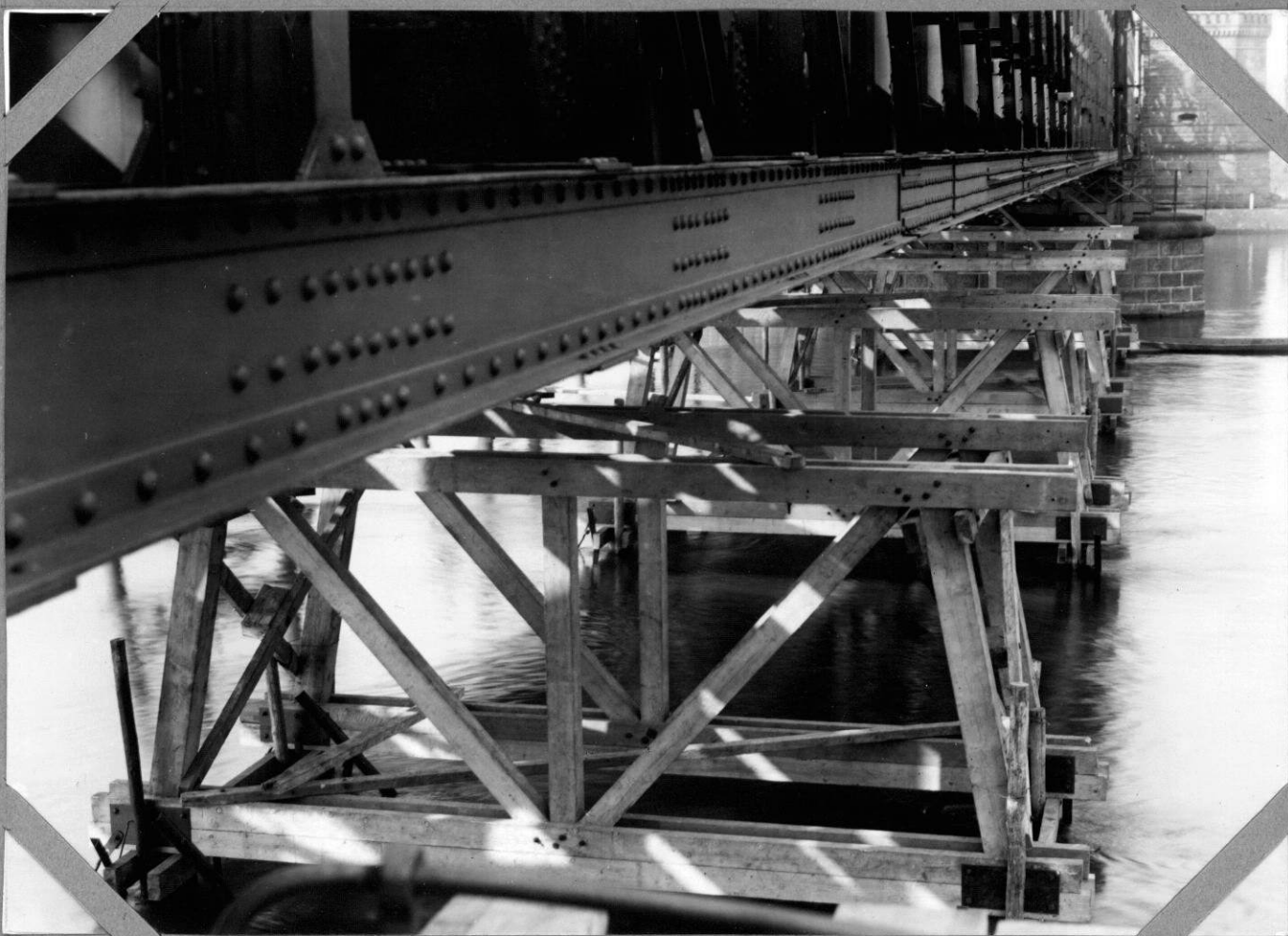
Dépose du tablier métallique Echafaudages sous la travée centrale 21-3- 1938