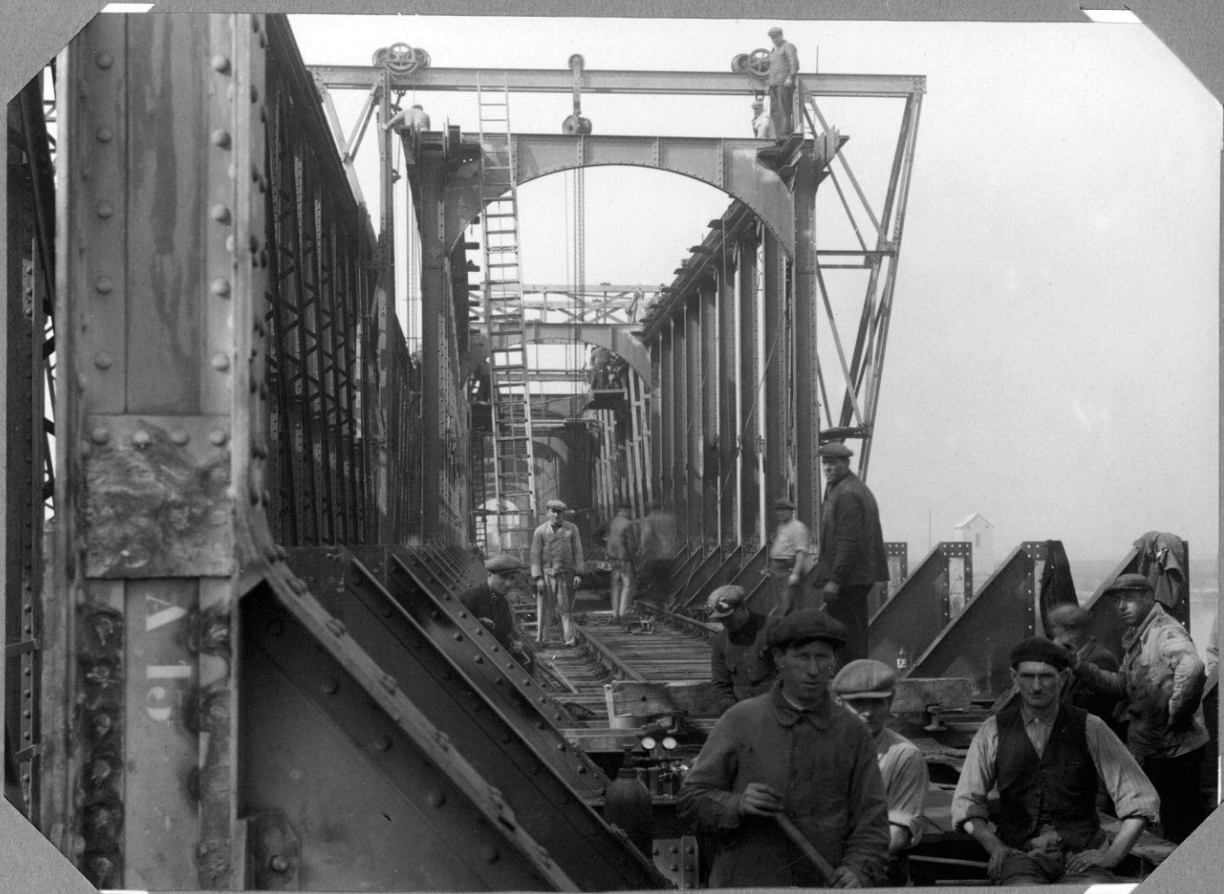
Dépose du tablier métallique Démontage de la travée rive droite 29-3-1938