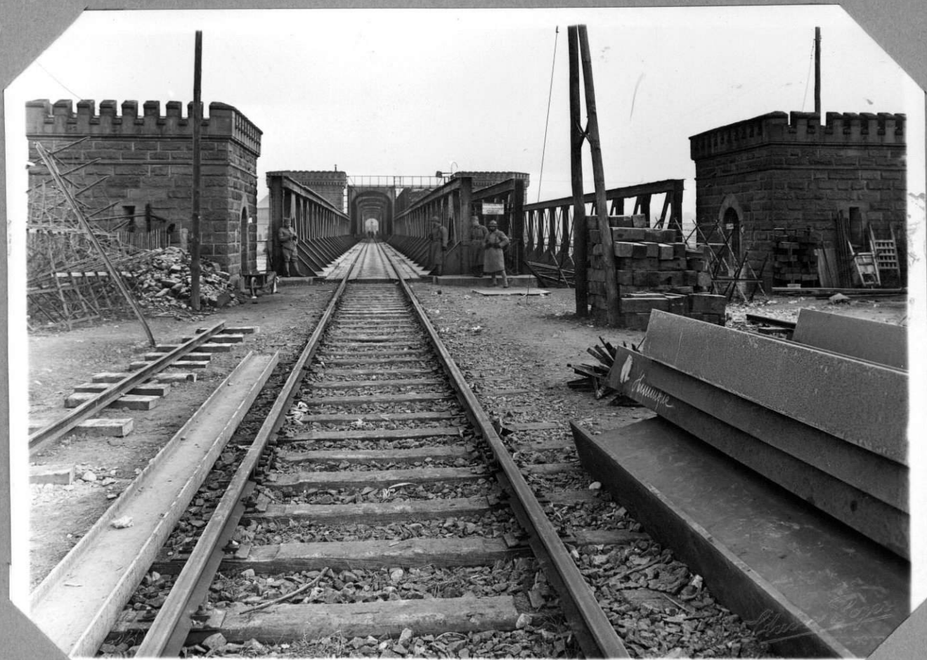
Dépose du tablier métallique Situation avant commencement des travaux Vue prise du côté Ouest (Tête du pont côté Huningue) 30.12.37