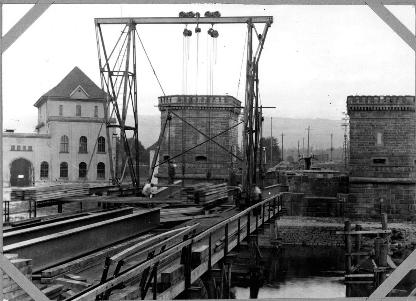
Dépose du tablier métallique Enlèvement des poutrelles d'échafaudage 9 - 5 - 1938