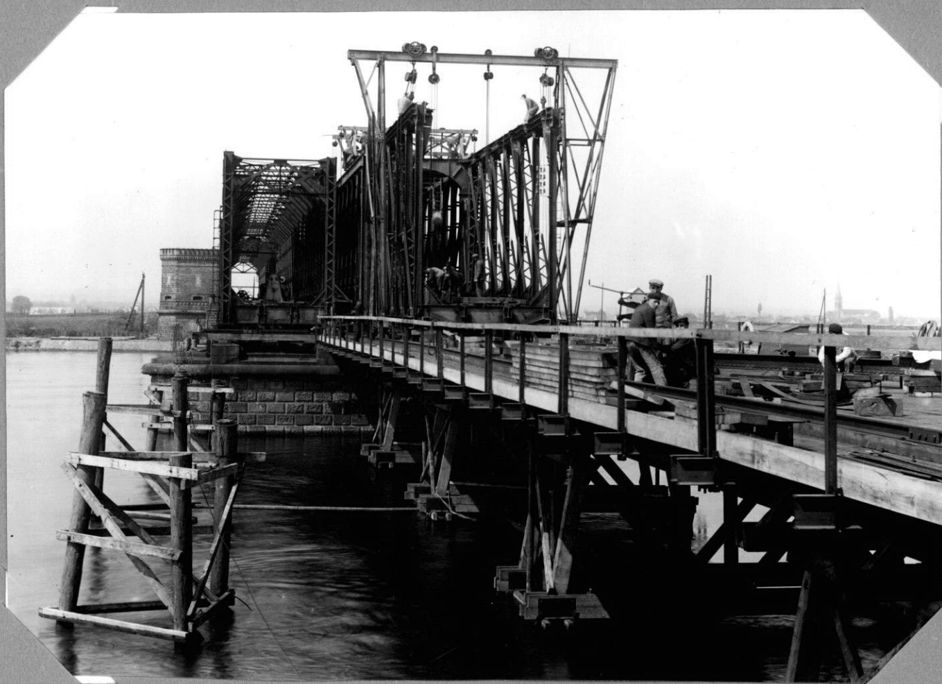
Dépose du tablier métallique Démolition du 1 er tablier en fer 5 - 5 - 1938