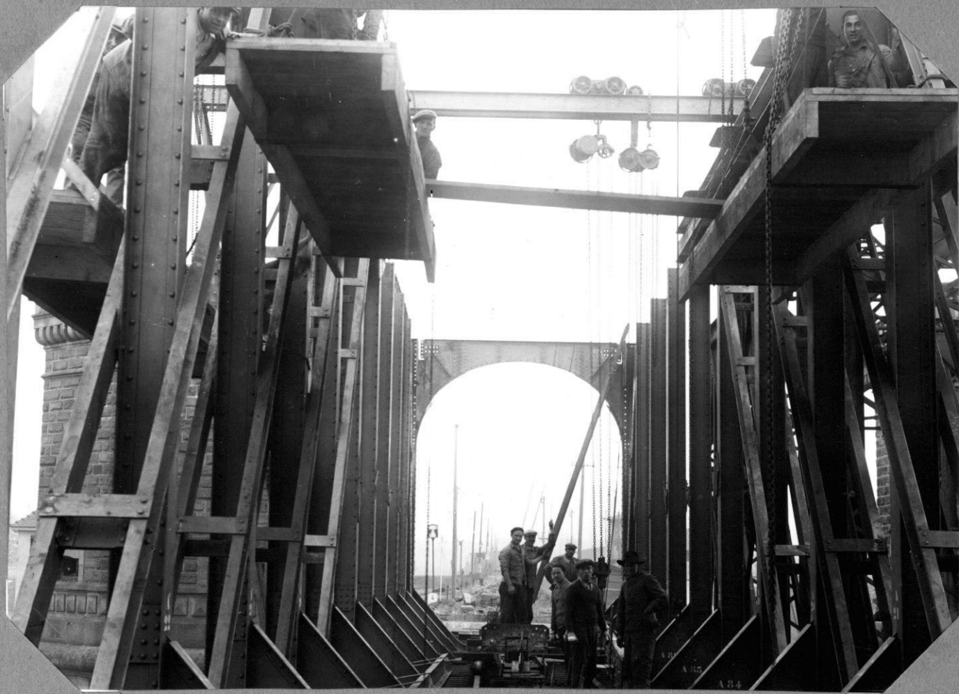
Dépose du tablier métallique 1ère travée, rive allemande, 1 tronçon des membrures supérieures enlevé 21-3-1938