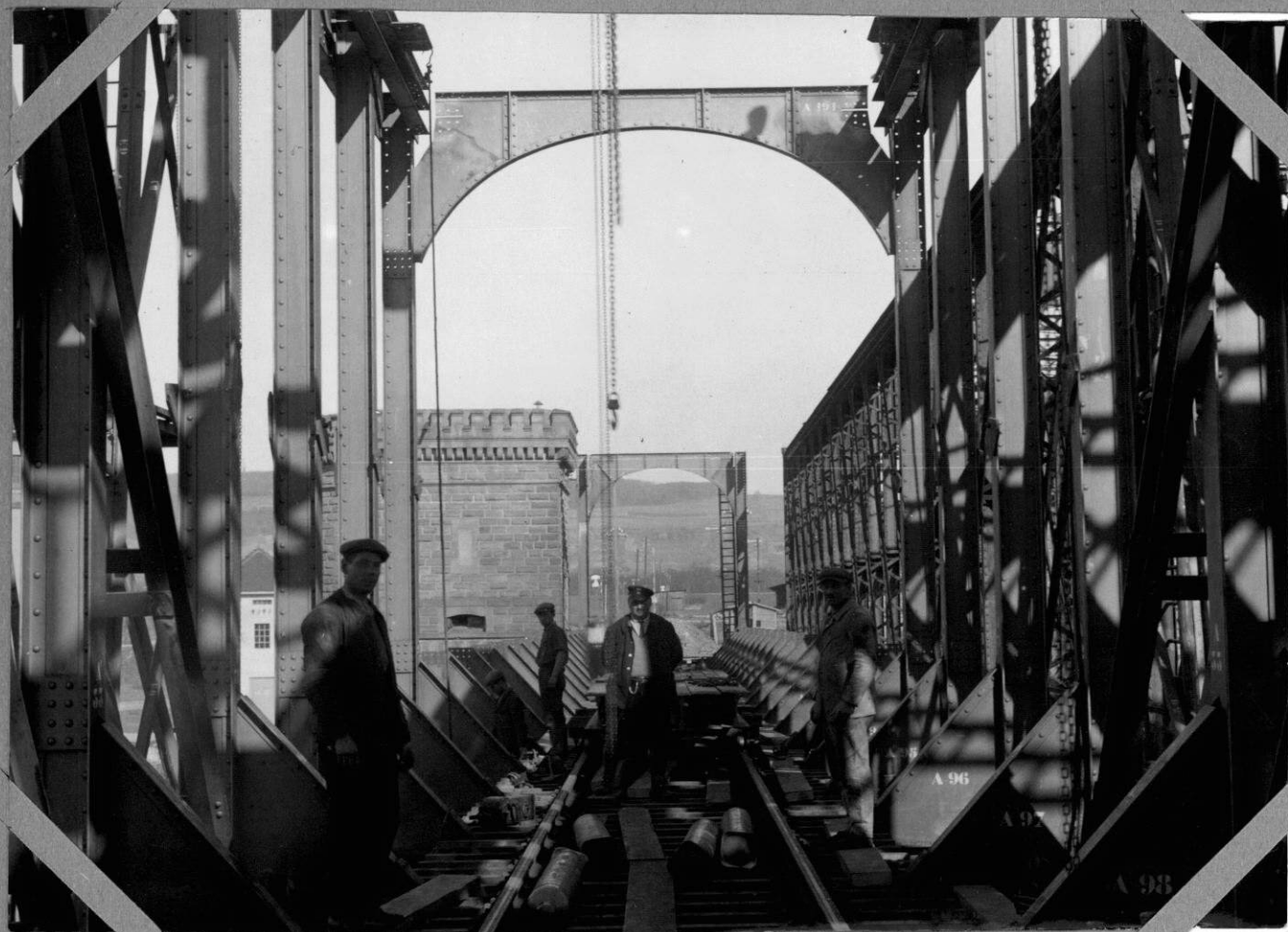
Dépose du tablier métallique Démontage de la travée rive droite 1-4-1938