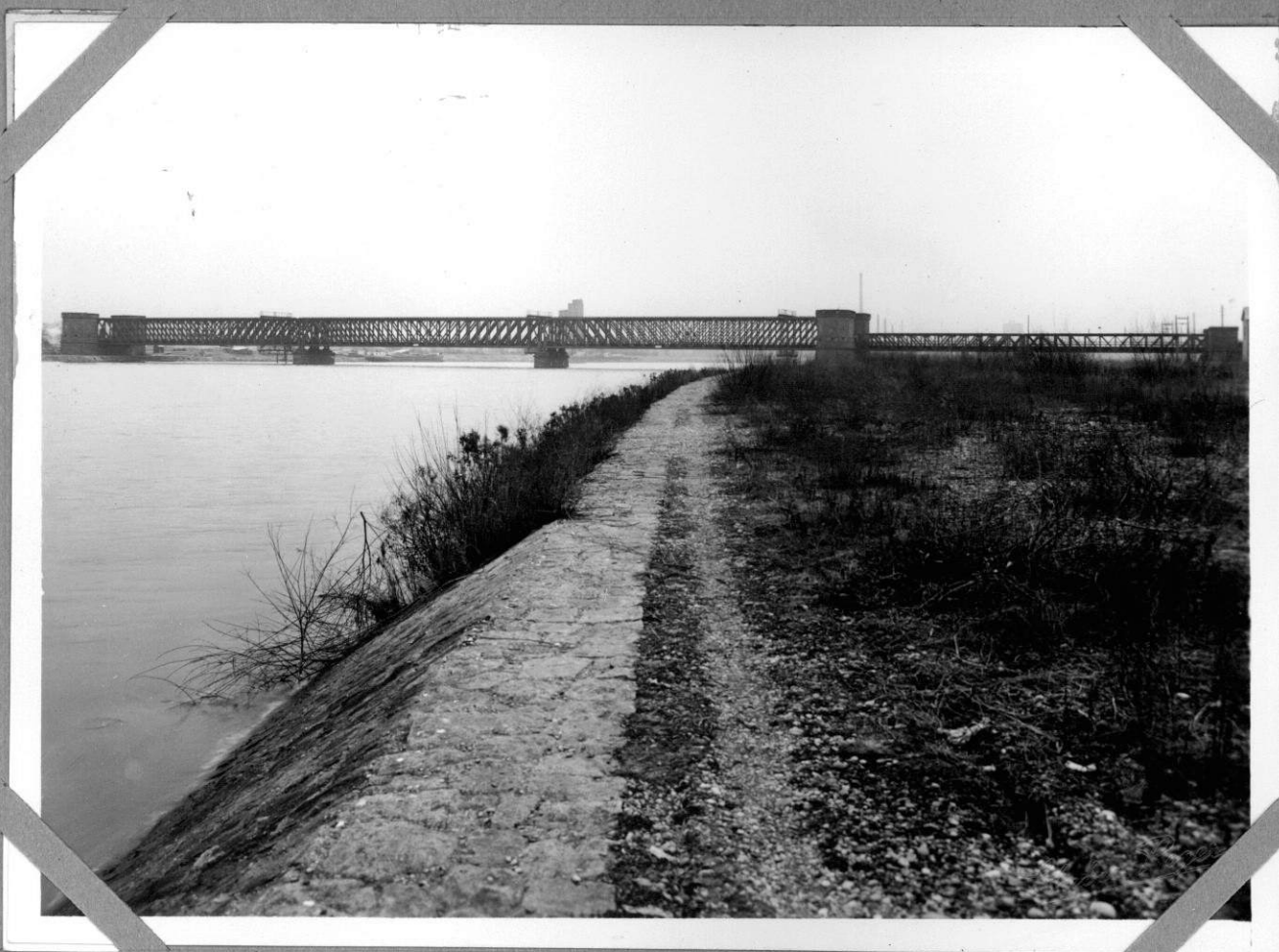
Dépose du tablier métallique Situation avant commencement des travaux Vue prise du côté Nord (aval) 30.12.1937