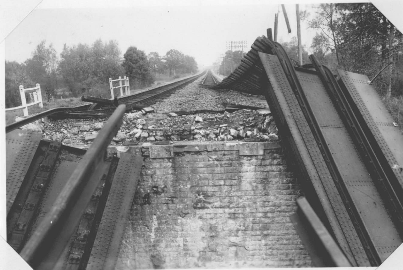
— Culée côté Saumur - le 28.10.44 —