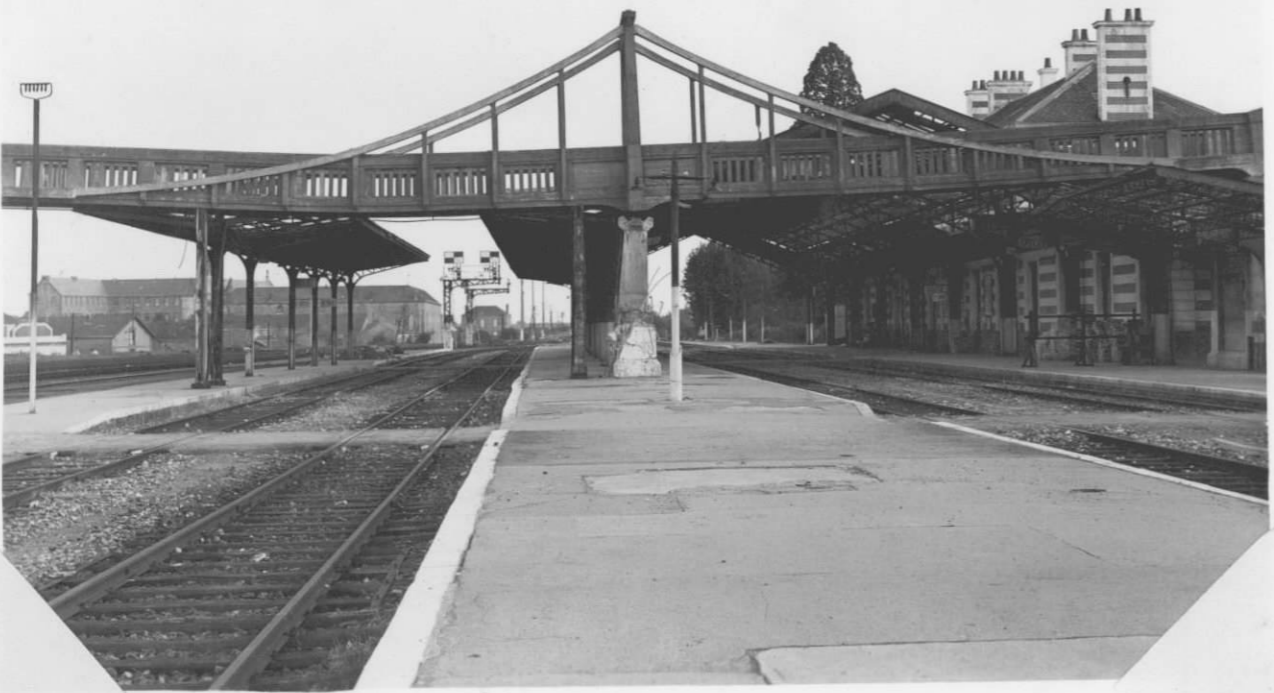
— Vue du pilier détruit. le 11.10.44 —