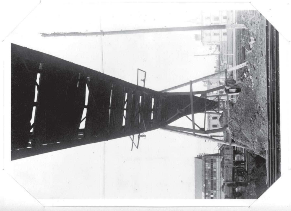
— Déformation des travées 1 et 2 —