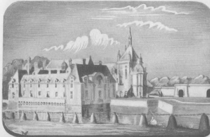
CHATEAU DE CHANTILLY

VERSAILLES. — Palais (édifié par Mansard). Parc (dessiné par Le Nôtre). Petit et Grand Trianon. Grandes et Petites Ecuries. Salle du Jeu de Paume. Eglises N.-Dame, St-Louis. Musées.