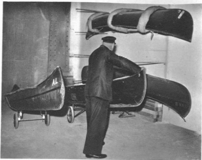
Consigne des canoës en gare d'Austerlitz.