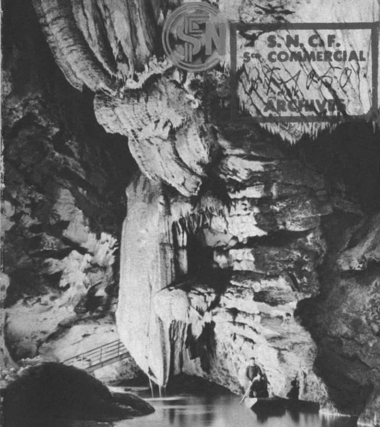
PADIRAC Le Lac de la Pluie.

Publicité S. N. C. F. (R. S.-O.) N° 139-1939 -50.000 Ex. R. C. Seine 276.448 B. Printed in France for and by French National Railways. T. C. F. DRAEGER, IMP.