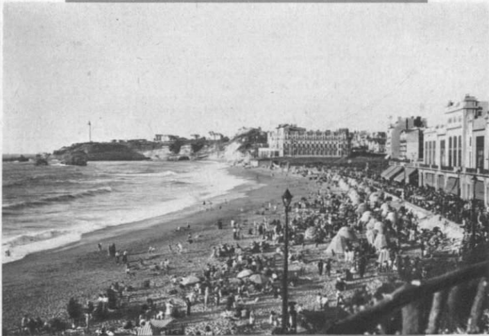
BIARRITZ - La plage

Le pays Basque présente cette charmante originalité de conserver vivantes les traditions de la plus ancienne civilisation française, et d'offrir, en même temps, au voyageur, les plus brillants aspects de la vie moderne.